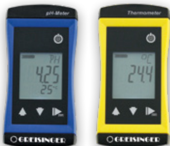
G 1500 pH-Meter und G 1700 Kompaktthermometer