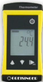
G 1500 pH-Meter und G 1700 Kompaktthermometer